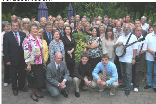
Abschied von Hamm beim „Heimatabend“

Samstag, 21. Juni: 7.00 Uhr Time to say „Good Bye!“ / Fahrt zum Frankfurter Flughafen um unsere amerikanischen Gäste zu verabschieden.