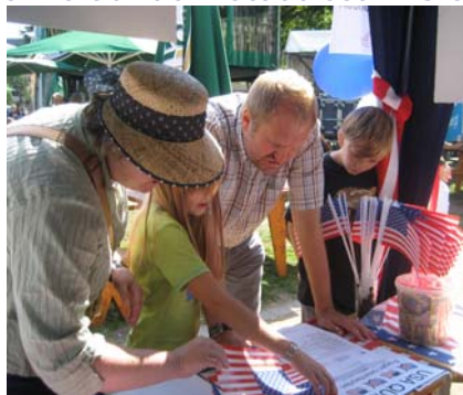
Beim USA-Quiz gab es auch Fragen zur Städtepartnerschaft

Am 16. August präsentierte der Städtepartnerschaftsverein Gießen - Waterloo, Iowa, im Rahmen des jährlichen Stadtfestes in Gießen Informationen über die Partnerschaft, die seit 1981 existiert. Mitglieder des Vereins informierten interessierte Gießener über ihre Aktivitäten, einschliesslich ihrer Reisen nach Waterloo, Iowa. Unterstützt wurde der Verein vom US-Generalkonsulat. Besucher nahmen am USA-Quiz teil, informierten sich über Austauschmöglichkeiten mit den USA und erhielten Antworten auf ihre Visafragen.